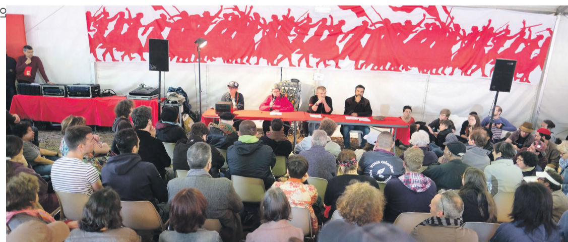
Durant la Fête de Lutte ouvrière, le débat organisé autour de la grève des cheminots a eu un franc succès avec plus de 500 personnes présentes.