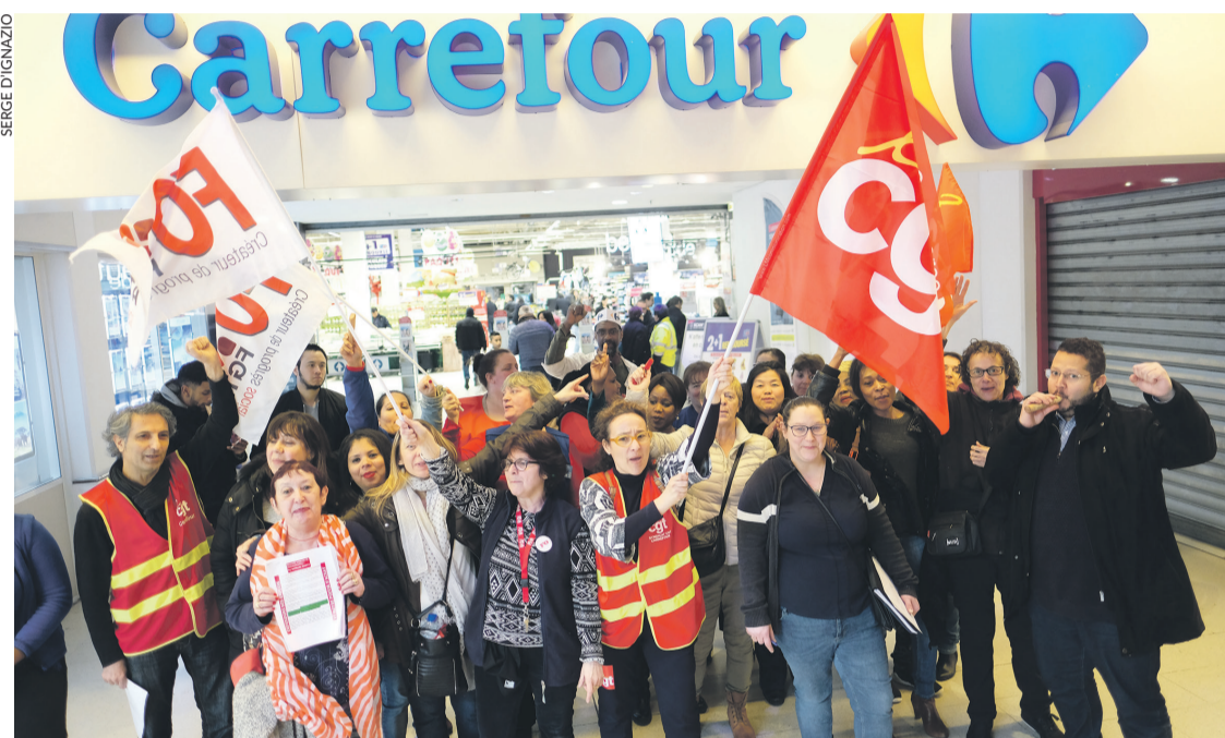
Mobilisation contre le plan Bompard.