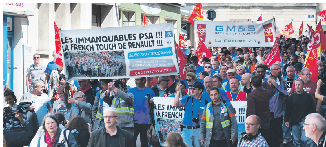
En manifestation à Poitiers en mai 2017.