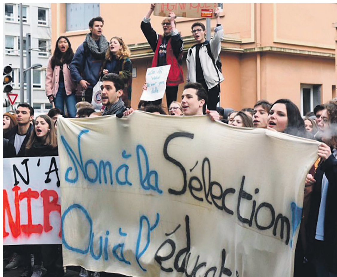
Manifestation étudiante à Rouen le 31 janvier.