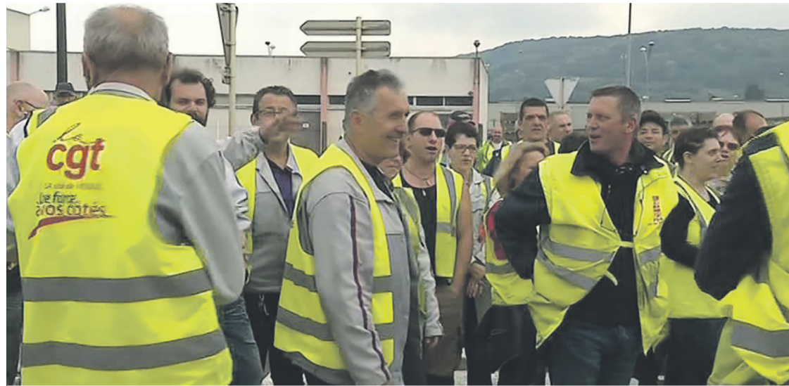
Le débrayage du 17 mai.