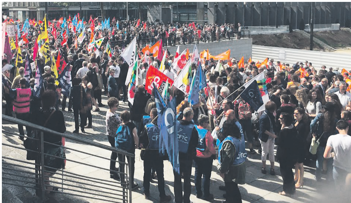
FRANCE 3 BRETAGNE