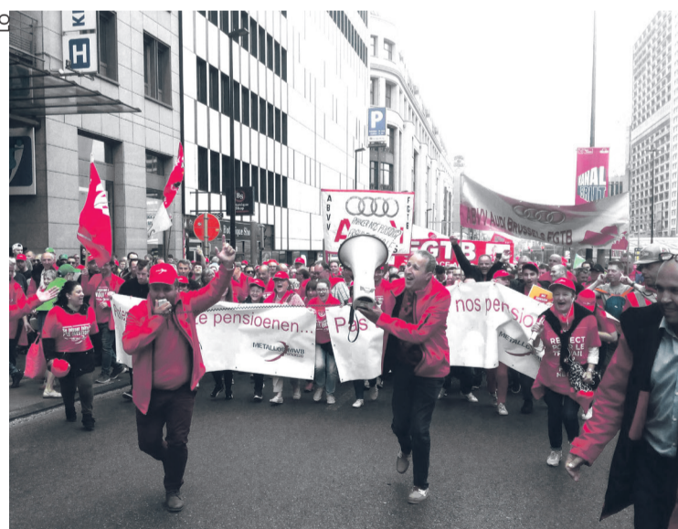
Bruxelles, le 16 mai.